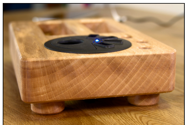
Attraktive Färbung des Buchenholzes