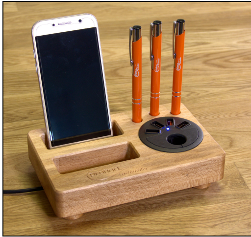
Ladestation für zwei Handys