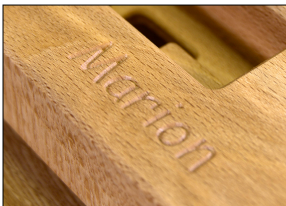
Mit individuellem Schriftzug möglich