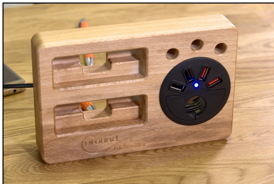
Verschiedene Varianten sind möglich